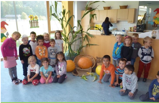
Kindergarten Kirchbichl/Bruckhäusl, 22,5 kg