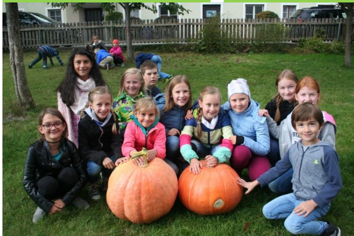
VS Flauring, 29 kg