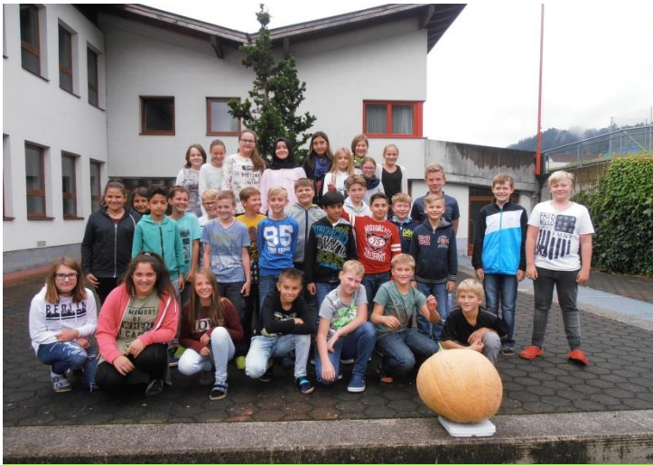
NMS Vomp/Stans, 29 kg