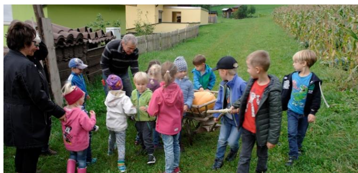
KG Karrösten, 9,2 kg