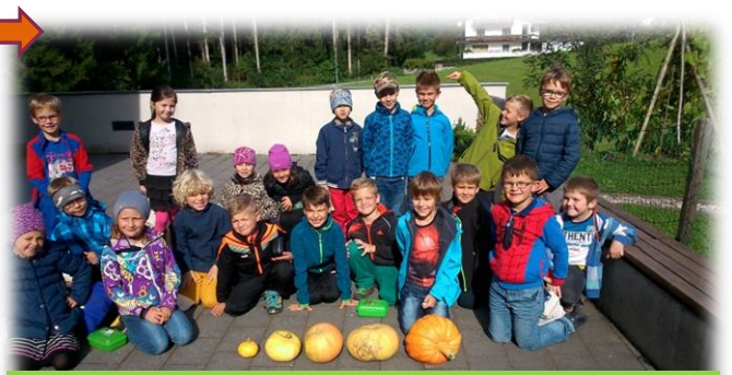
VS Angerberg: 5,6 kg

Zur Jause gab`s an diesem Vormittag: Apfelsaft / Kohlrabi / Kürbiscremesuppe.