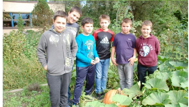
NMS Völs, 16,20 kg