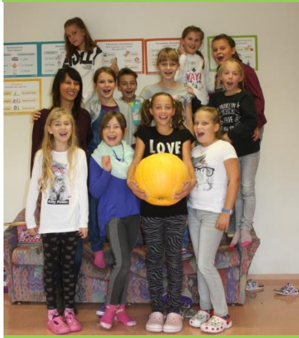
VS und OGV Nauders, 10,8 kg