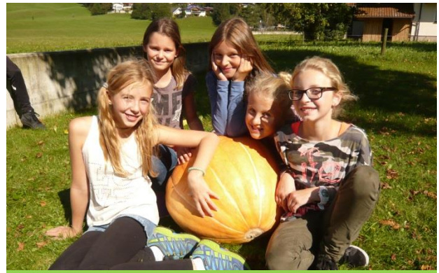
Gartengruppe NMS Niederndorf, Kürbis „Olaf“ 43,9 kg