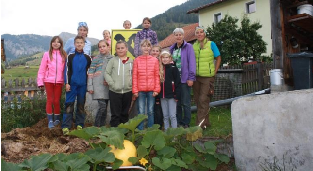
VS und OGV Nauders, 10,80 kg